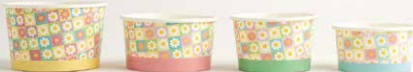
REF. 23 - 230 cc